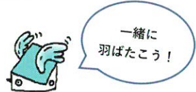
公式キャラクター「ネッピー」

高校時代は、人生の方向を決める大切な時期です。「もっと広い世界を見て自分の人生を考えたい」「全国の同世代と将来への夢を語り合いたい」。そんな次世代を担う高校生を応援するサマースクールが「日本の次世代リーダー養成塾」です。世界を舞台に活躍する講師から吸収して、日本やアジアの仲間達と徹底的に議論して、自分の頭をフルに使って考え抜きます。14日間で将来が必ず見えてきます。