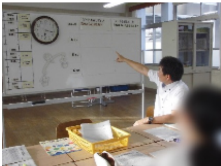
拠点校での指導場面