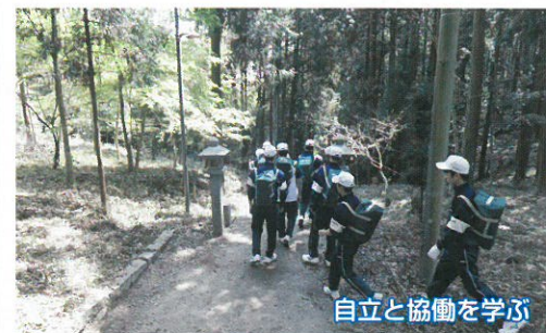
自立と協働を学ぶ

年間をとおして、育徳館ならで はの学校行事が準備されていま す。なお、掲載内容は29年度 実施予定のものです。