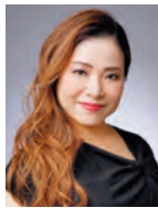
並河寿美 Hisami NAMIKAWA

故レナード・バーンスタイン、小澤征爾らに師事。1989年プザンソン国際指揮者コンクール優勝。これまでパリ管弦楽団、ベルリン・フィルハーモニー管弦楽団等欧州の一流オーケストラを多数指揮。現在オーストリアのトーンキュンストラ管弦楽団音楽監督、兵庫県立芸術文化センター芸術監督、シエナ・ウインド・オーケストラの首席指揮者を務める。著書に「僕はいかにして指揮者になったのか」(新潮文庫)など。2023年4月より新日本フィルハーモニー交響楽団音楽監督に就任。オフィシャルファンサイト: http://yutaka-sado.meetsfan.jp